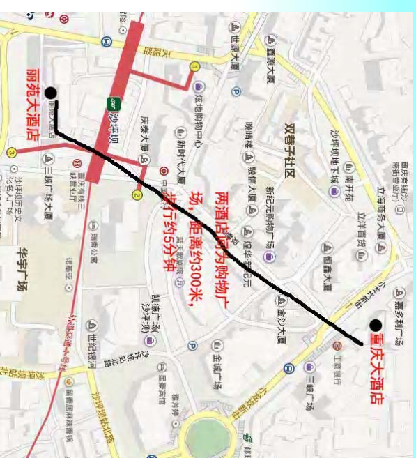
两协议酒店示意图